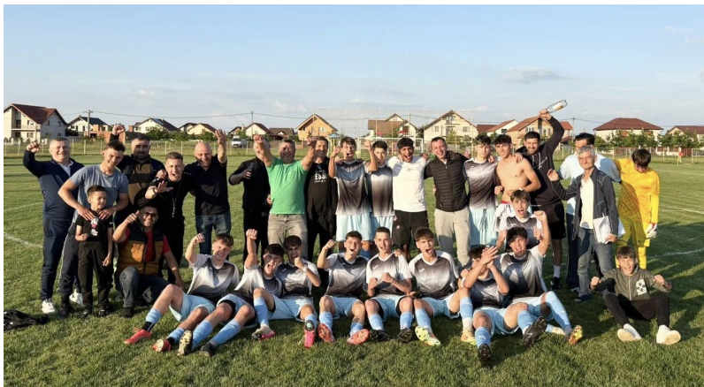
Clasament PLAYOFF - JUN.A1 » Etapa 7 » Sezon 2025 - 2026 (TUR →)