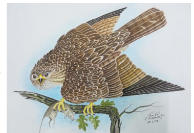
Șorecar comun (Buteo buteo), m. egereszolyv, Ge. Mausebussard

Șorecarul comun este o pasăre de pradă. Pasărea are o lungime de 43-60 cm lungime, anvergură de 100-125 cm, cu aripi lungi, coada lungă rotunjită la vârf și cu gât scurt. Are un colorit foarte variabil. Exemplarele albe peștrițe existente pe continent pot fi confundate cu șorecarul încălțat, acvila mică și șerparul, însă acești șorecari au adesea pe aripă pete mari albe și dedesubt, la încheietura aripii pete de culoare închisă. Subspecie estică ( Buteo buteo vulpinus ) este mai ruginie, asemănându-se cu șorecarul mare. În Europa răsăriteană există indivizi intermediari. Au un strigăt prelung ca un mieunat, frecvent emis: chiee . Zboară cu bătăi încete de aripi și adesea se rotește în aer survolând solul.