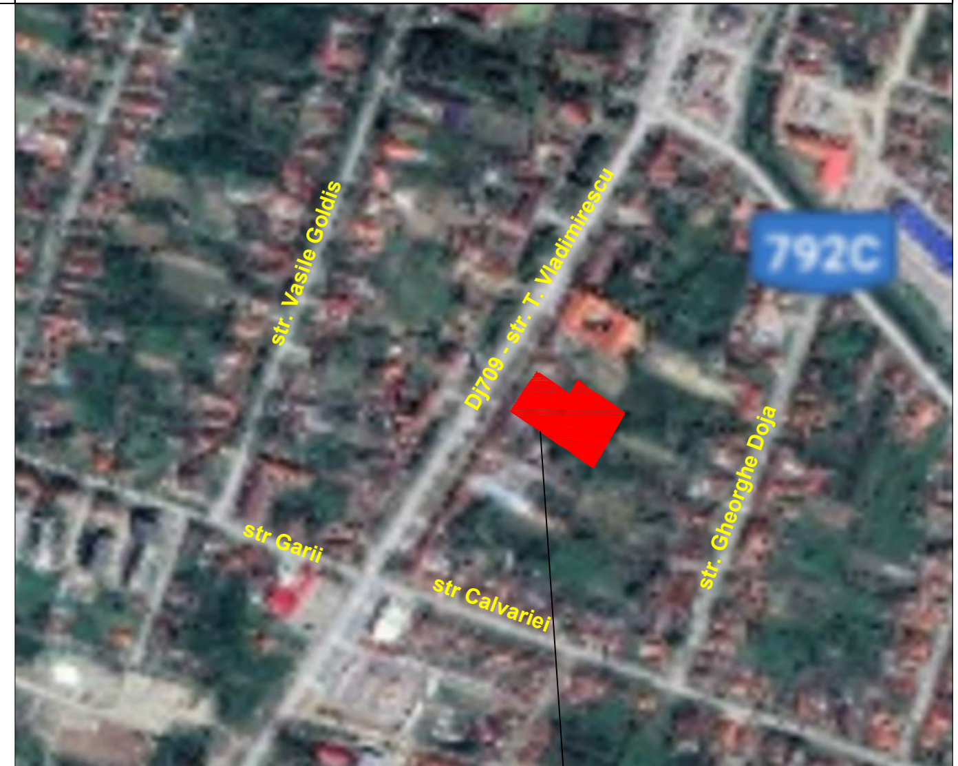
amplasament studiat P.U.D. CONSTRUIRE MAGAZIN PENNY MARKET