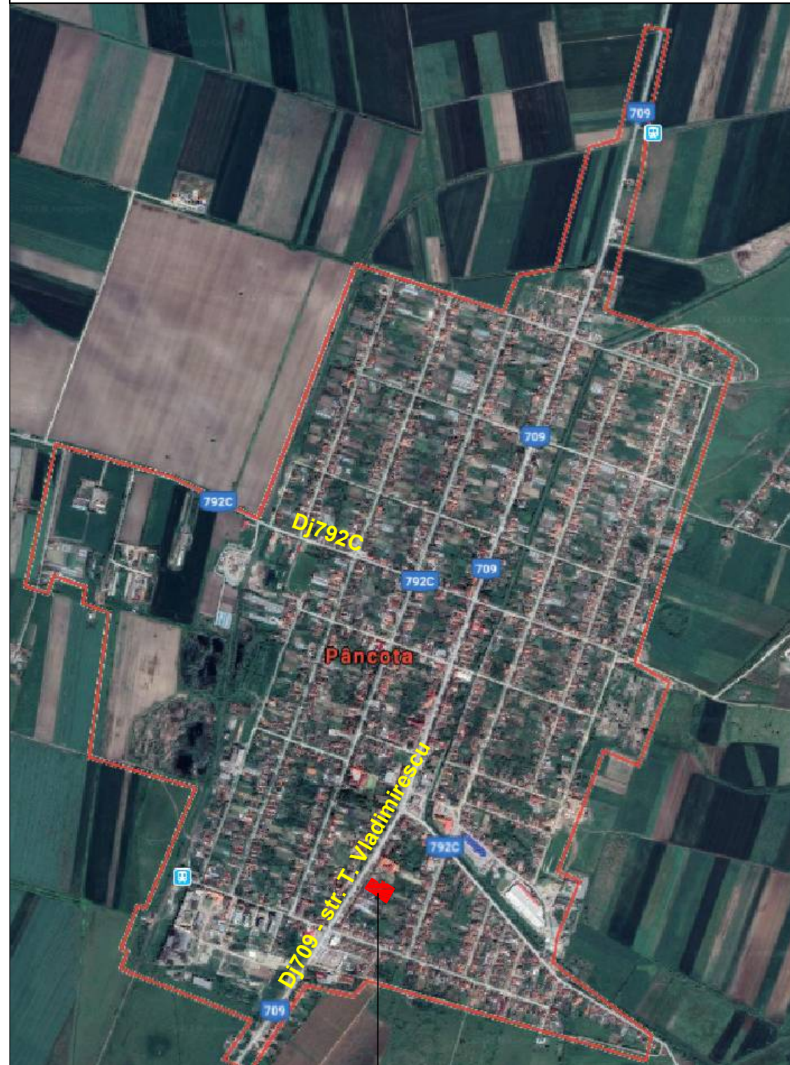
amplasament studiat P.U.D. CONSTRUIRE MAGAZIN PENNY MARKET